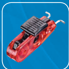
S2390 - Passt auf Schaltern 11 mm oder kleiner