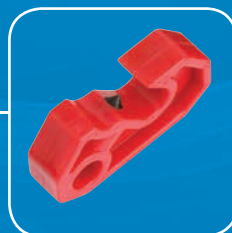
S2393 - Universal Verriegelung für Schutzschalter