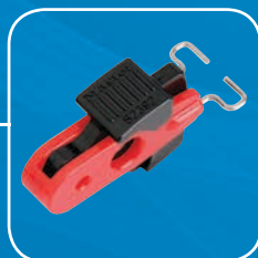
S2392 - Passt auf Schalter aussenliegende Schalter