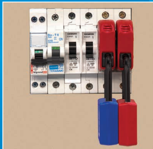
S2394 Mehrfachverriegelung nebeneinander mit Schloss 410s.