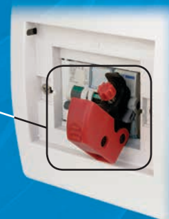
S2394 -werkzeugfreie universal Verriegelung für Schutzschalter